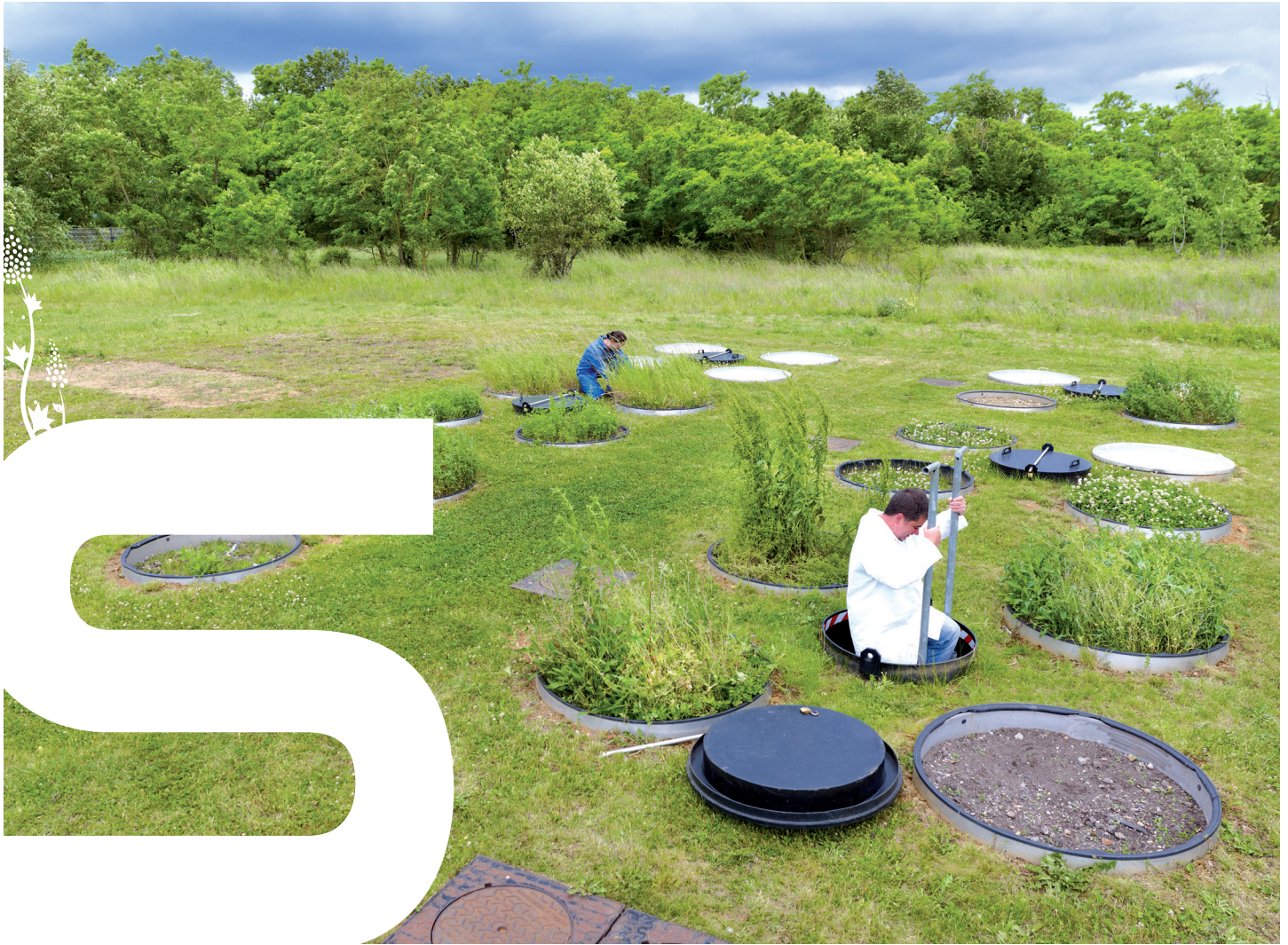
Le dispositif en colonne implanté sur la station : 24 lysimètres de 2 m 3 instrumentés à 2 m de profondeur.